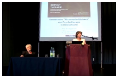
Vermessene Wissenschaftlichkeit Kongress in Kassel 2014 www.youtube.com/watch?v=cprvSKgDCGQ