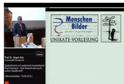
Systemtheorie u. systemisch-humanistische Psychotherapie Herausforderung f.uns. Gesellschaft? https://lecture2go.uni-hamburg.de/l2go/-/get/v/10905