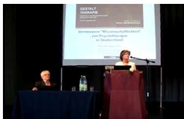
Vermessene Wissenschaftlichkeit Kongress in Kassel 2014 www.youtube.com/watch?v=cprvSKgDCGQ