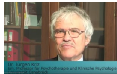
Arbeitsbeziehung i.d. Therapie Kongress Uni Krams 2012 www.youtube.com/watch?v=1Dpyz9QWNs4