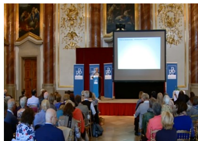
Chaos vs. Zwangsneurose Hilft Askese gegen die Angst? (RPP – Institut, Wien 2015) www.youtube.com/watch?v=kRcZu8hiQVU