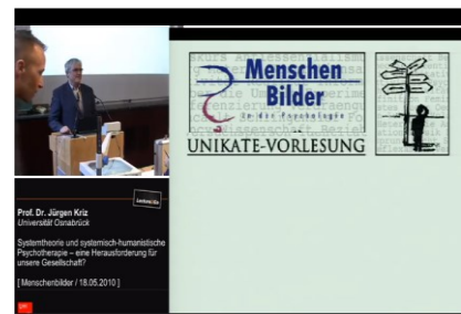
Systemtheorie u. systemisch-humanistische Psychotherapie Herausforderung f.uns. Gesellschaft? https://lecture2go.uni-hamburg.de/l2go/-/get/v/10905