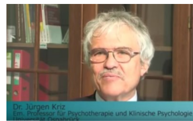
Arbeitsbeziehung i.d. Therapie Kongress Uni Krams 2012 www.youtube.com/watch?v=1Dpyz9QWNs4